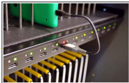
Naprava med ponjenjem